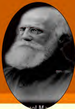
David Samuel Margoliouth